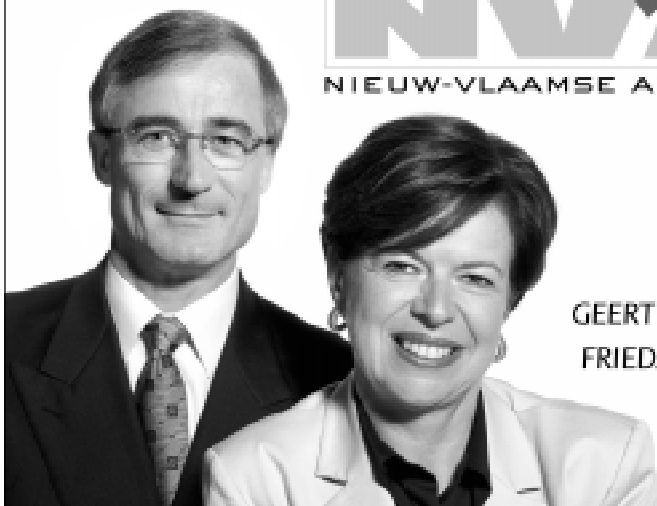
GEERT BOURGEOIS FRIEDA BREPOELS