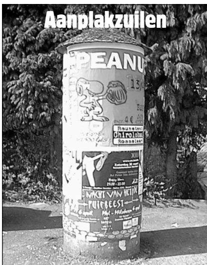
Wat het zou kunnen zijn...

Onderstaande tekst schreven wij in de Betrokkenheid van april 2002: "In Dessel gaan aanplakzuilen komen. U zal het geweten hebben, want ze worden al jaren aangekondigd door de CD&V. Ook het jeugdwerkbeleidsplan en de jeugdraad maken er al twee jaar gewag van en pakken er telkens opnieuw mee uit alsof het een grote nieuwigheid betreft. Op deze zuilen kunnen verenigingen hun activiteiten promoten (zie foto). De vraag blijft evenwel waarop men wacht. Wat is er nu zo moeilijk? Waarom moet dat jaren duren? Blijkbaar wordt nu de laatste hand gelegd aan een reglement. We zijn benieuwd." Spijtig, maar nu, anderhalf jaar later, zijn er nog steeds geen aanplakzuilen te bespeuren in Dessel... Jongens, wat een lijdensweg, drie jaar lang om een paar buizen neer te poten!