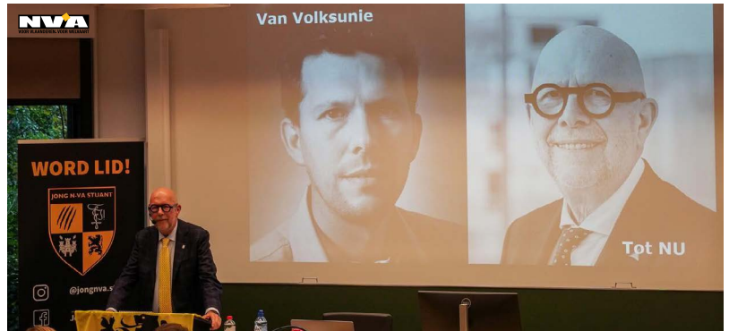
Foto: Luk Lemmens vertelde o.a. over de strijd voor taalrechten in Vlaanderen.