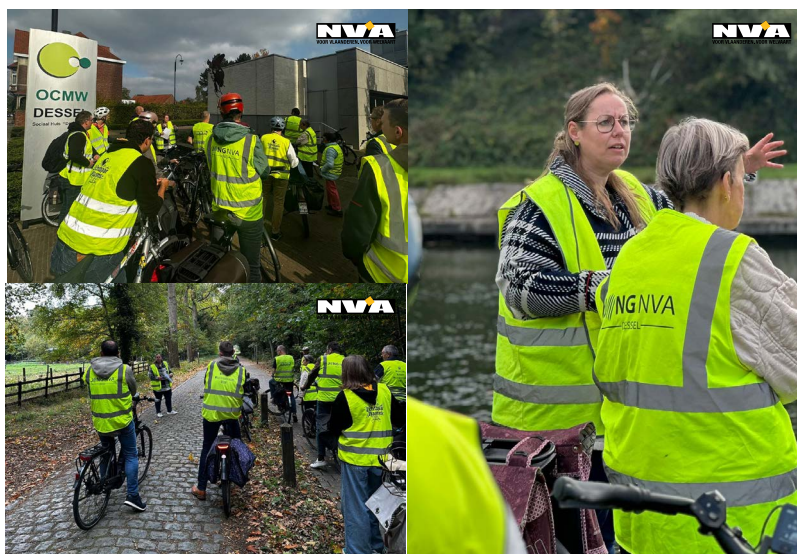
Foto: Tijdens Toerist in eigen dorp (editie CulTour) ontdekten we de verhalen achter de verschillende kunstwerken in Dessel.

Wil je de CulTour zelf eens fietsen? Dan kan je de kaart downloaden via de site van de gemeente of eens langsgaan bij de dienst toerisme!