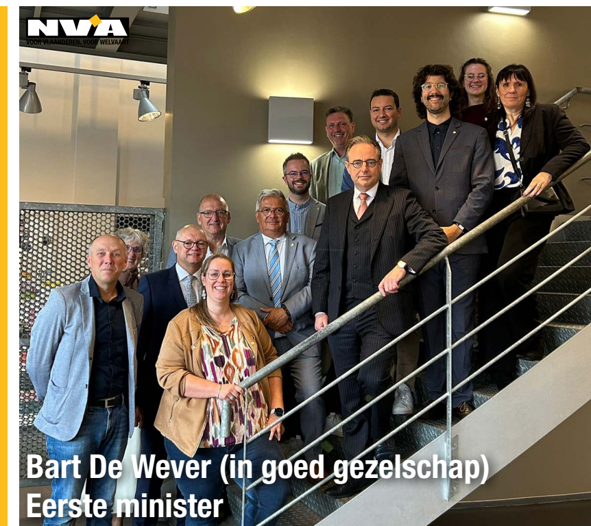
Bart De Wever (in goed gezelschap) Eerste minister

In Tablooo loofde hij het voorafgaande, baanbrekende en wereldwijd unieke participatietraject dat hier de voorbije decennia tussen NIRAS, de gemeenten Dessel en Mol en de partnerschappen Stora en Mona werd gelopen. Op de werf zelf werd een tijdscapsule in een blok beton gecementeerd met daarin boodschappen voor de Desselaar en Mollenaar van het jaar 2325.