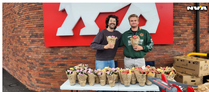
Foto: Jong N-VA in actie: Ten voordele van Kom Op Tegen Kanker organiseerde Jong N-VA Dessel opnieuw een plantjesverkoop in Dessel.