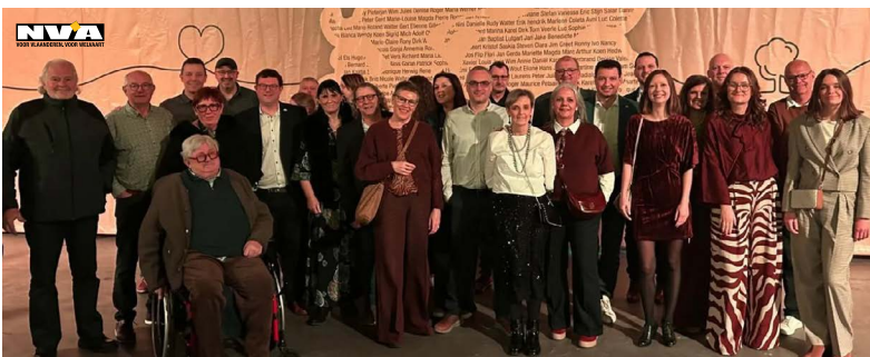
Foto: N-VA Dessel was weer goed vertegenwoordigd op de altijd gezellige nieuwjaarsreceptie.