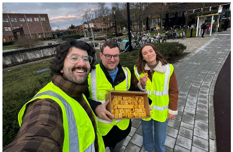
Foto: Jong N-VA Dessel in actie. Op vrijdag 13 januari stonden onze jongeren weer paraat om de jeugdige passanten op de markt te verrassen met de traditionele valentijnschocolaatjes.