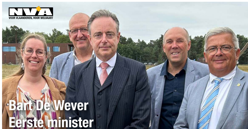
Bart De Wever Eerste minister

Op internationaal vlak weet de premier zich via dossierkennis en