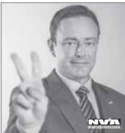
Bart De Wever 1 ste Kamer