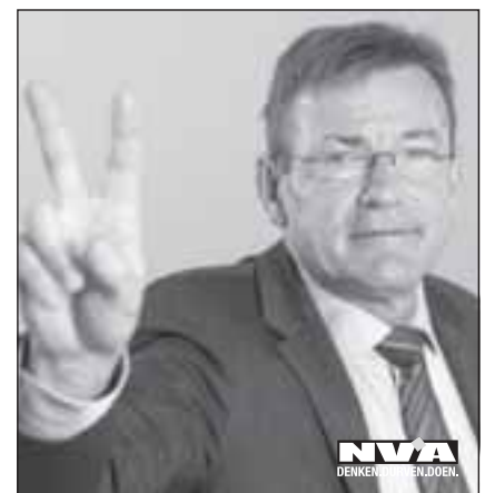
Johan Van Overtveldt 1 ste Europees Parlement