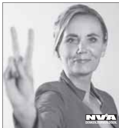
Liesbeth Homans 1 ste Vlaams Parlement