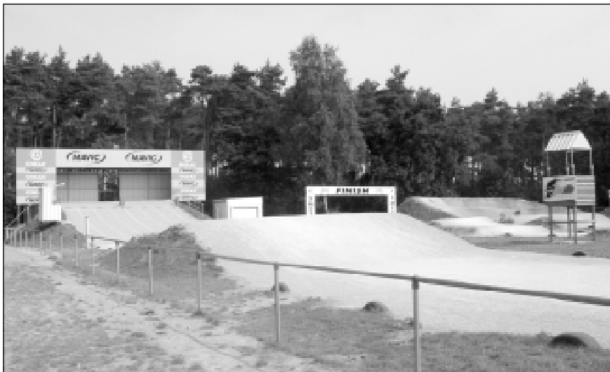
"Het BMX-parkoers ligt samen met de jeugdterreinen van Dessel Sport en de pleinen van Braberg en Kempenzonen in het BPA."