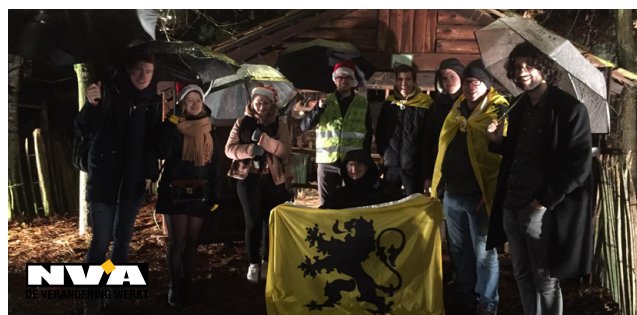
Foto's: Geïnspireerd door VVV Dessel en den Bunt bezocht Jong N-VA Dessel de 4 kerststallen.

We begonnen aan de kerststal op de Markt, van daar wandelden we naar de kerststal aan de Alfons Smet Residentie. Zo langs de gracht richting de kerststal aan de kerk van Witgoor, daar warmden we even op in café De Keeper. Van zodra we onze pintjes uit hadden en genoeg waren opgewarmd, wandelden we verder langs de Meistraat en terug langs de gracht en verder tot in de Heegstraat. Toen bezochten we de kerstkapel van de Hei en afsluiten deden we in De Campina. Zo was de toon voor de rest van de feestdagen gezet!