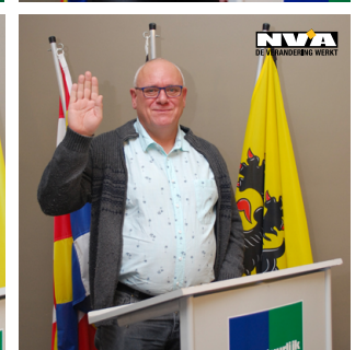
Foto's: De burgemeester, raadsliden en leden van het Bijzonder Comité tijdens hun eedaflegging.