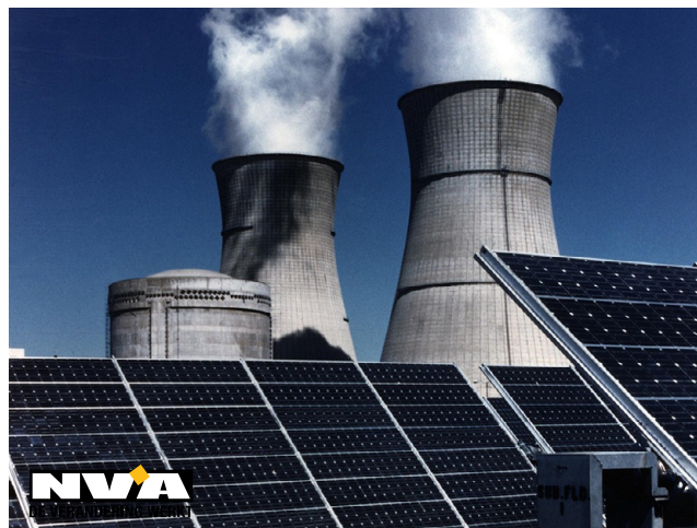
Foto's: De witte rook die uit de koeltoren komt, is waterdamp en bevat geen schadelijke stoffen.

Als we spreken over klimaat en milieu kunnen we energie niet uit het verhaal laten. Daarom moeten we werken met ‘groene energie’. Als je deze woorden hoort, denk je vaak aan zonnepanelen en windmolens. Hoewel dit juist is, is er nog een efficiëntere groene energievorm. Iets waar de Desselaar genoeg van weet, kernenergie, een fenomeen dat zich ook in de natuur voordoet. De witte rook die uit de koeltoren komt van een kerncentrale is slechts waterdamp en schaadt de natuur niet en stoot niets uit. We moeten enkel kunnen omgaan met het afval. Wij, Jong N-VA Dessel, mochten een bezoek brengen aan Isotopolis waar al onze vragen werden beantwoord. Dit bezoek bevestigde nogmaals dat kerncentrales ons de nodige energie leveren zonder de natuur te schaden en dat het afval zeer gecontroleerd en veilig wordt geborgen.