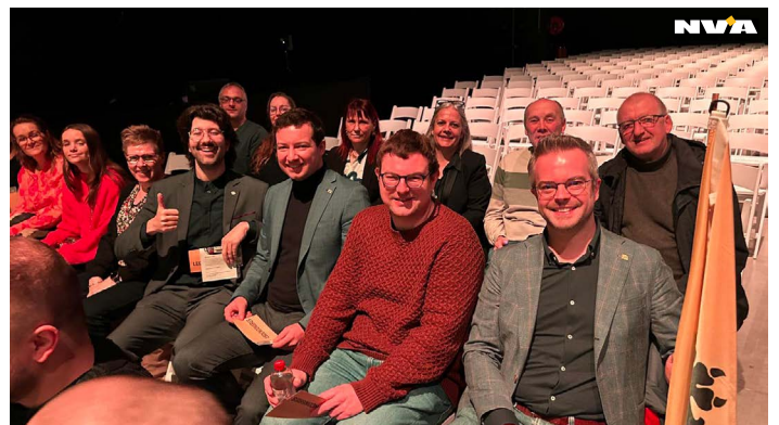
Foto: Wij waren met een mooie delegatie aanwezig op het toetredingscongres en gaven ook onze zegen voor toetreding tot de federale regering De Wever I.