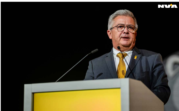
Foto: Kris zorgde ervoor dat het congres in goede banen werd geleid.