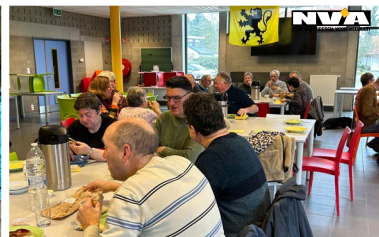
Foto's: Mooie wandelpaden, hartverwarmende drankjes, aangenaam gezelschap en lekker spek: de ideale ingrediënten van een geslaagd Dauwtrappen.