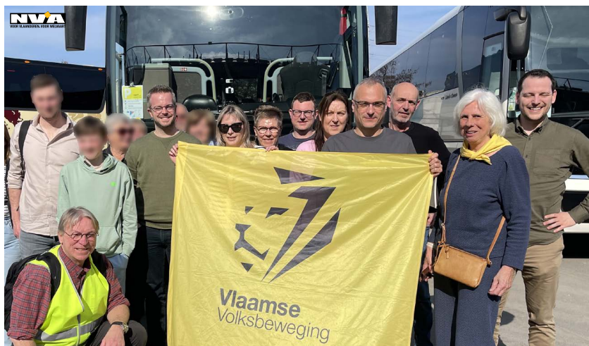
Foto: Met de bus trokken we naar de Lotto Arena voor alweer een gezellige editie van het Vlaams Nationaal Zangfeest.